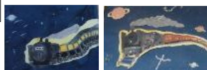
〈5年生：銀河鉄道の夜〉