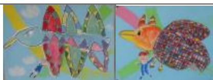
〈2年生：見つけたよ まぼろしの鳥〉