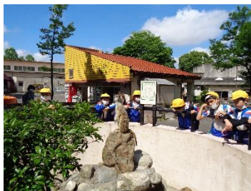
プレーリードッグ